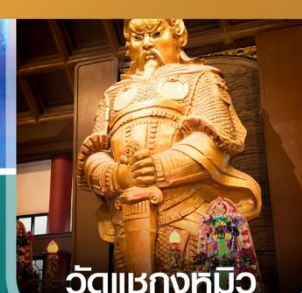
วัดเขาขงหมิว