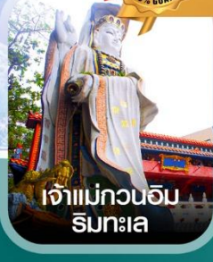
เจ้าแม่กวนอิม ริมทะเล